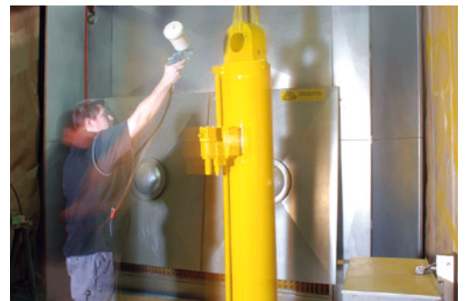
Qualitätsprüfung und Finishing