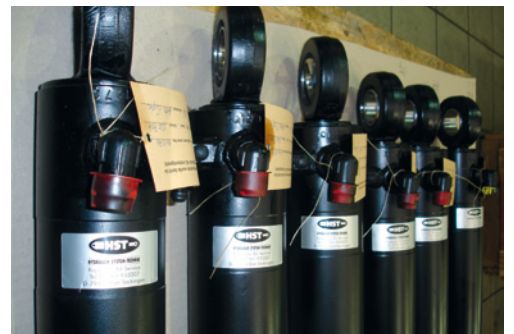
Revisionen und Neuanfertigungen